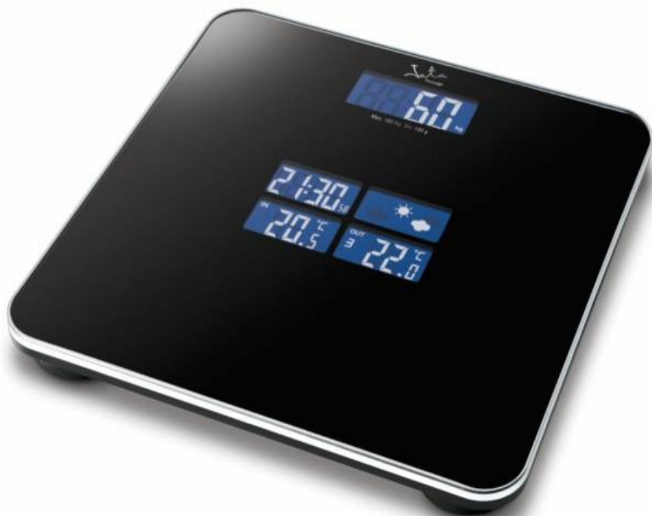
Jata електронен кантар с метео станция 530